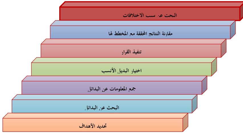
الشكل (2) مراحل عملية اتخاذ القرار المصدر: شرفا شريف، (2020)